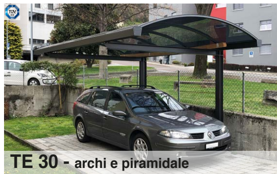
TE 30 - archi e piramidale

Plexiglas XT compatto 4 mm; finitura standard trasparente, bianco opale, fumé chiaro o scuro