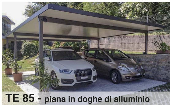
TE 85 - piana in doghe di alluminio

Plexiglas SDP alveolare 16 mm, finitura standard trasparente e bianco opale o Policarbonato alveolare 16 mm UV, finitura standard trasparente, bianco opale e bronzo fumé