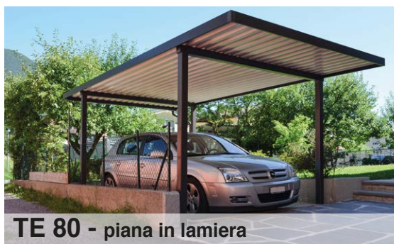
TE 80 - piana in lamiera

Plexiglas XT compatto 4 mm; finitura standard trasparente, bianco opale, fumé chiaro o scuro