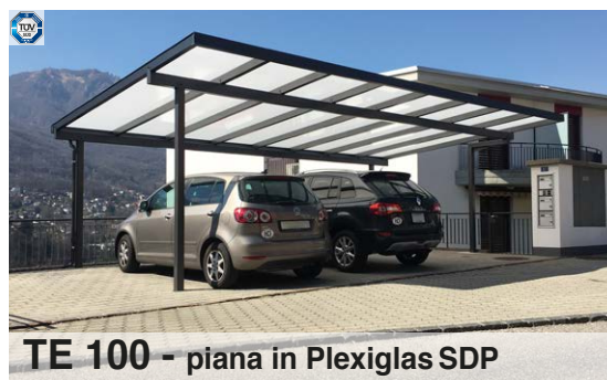
TE 100 - piana in Plexiglas SDP

Lamiera grecata di acciaio tipo SP 45 o 80; finitura RAL 9006 (lato superiore) e RAL 7045 (lato inferiore)