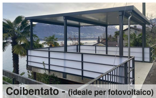
Coibentato - (ideale per fotovoltaico)

Copertura di protezione eseguita con lastre di vetro securizzato, temperato e indurito