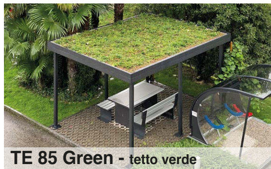
TE 85 Green - tetto verde

Doghe modulari in profilato di alluminio estruso colore standard grigio RAL 7035