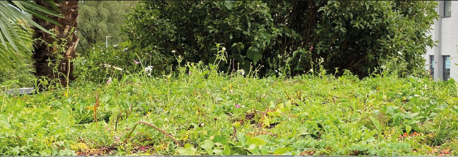
La vegetazione utilizzata è esemplificativa